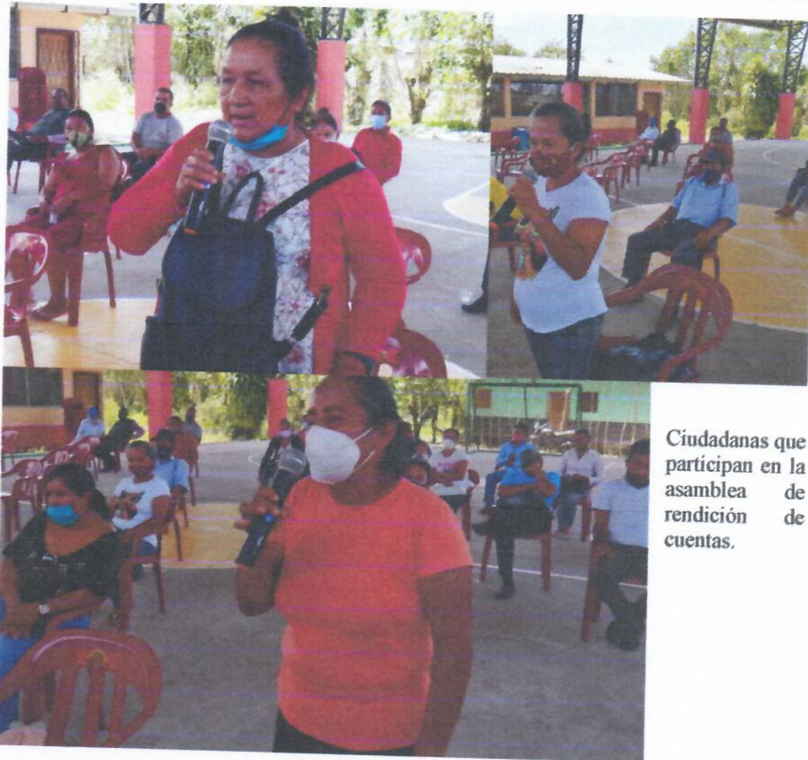
Ciudadanas que participan en la asamblea de rendición de cuentas.